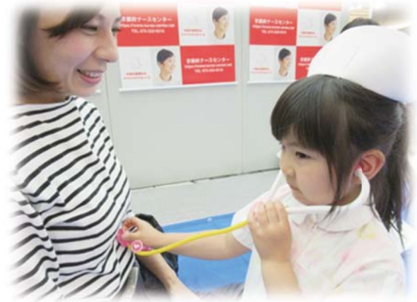
写真：看護の日イベント