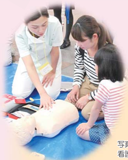
写真： 看護の日（京都市会場）

5月の「看護の日」を中心に府内5か所でイベント実施 夏に京都府内の病院を中心に、ふれあい看護体験を実施 看護の心をみなさんに伝えます