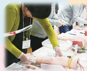
写真：看護力再開発講習会

無料職業紹介事業（ハローワーク等移動就業相談など） 未就業看護師等の再就業に向けた事業（再開発講習会など） 看護師等確保対策（施設訪問など） セカンドキャリア交流会（定年後の再就業支援） 看護師等届出制度（とどけるん登録促進）